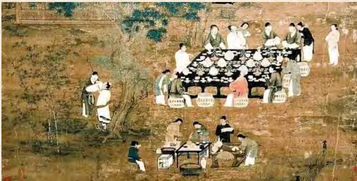
（北宋赵佶所绘《文会图》（局部））

中国古代最讲究的食客，莫过于清朝的袁枚，他写的《随园食单》不仅介绍了南北菜肴饭点及名茶名酒，还讲了不少厨事原则和饮食原则，其中的对各种细微之处的在意，让人感觉他实在是一个用生命去吃的人。