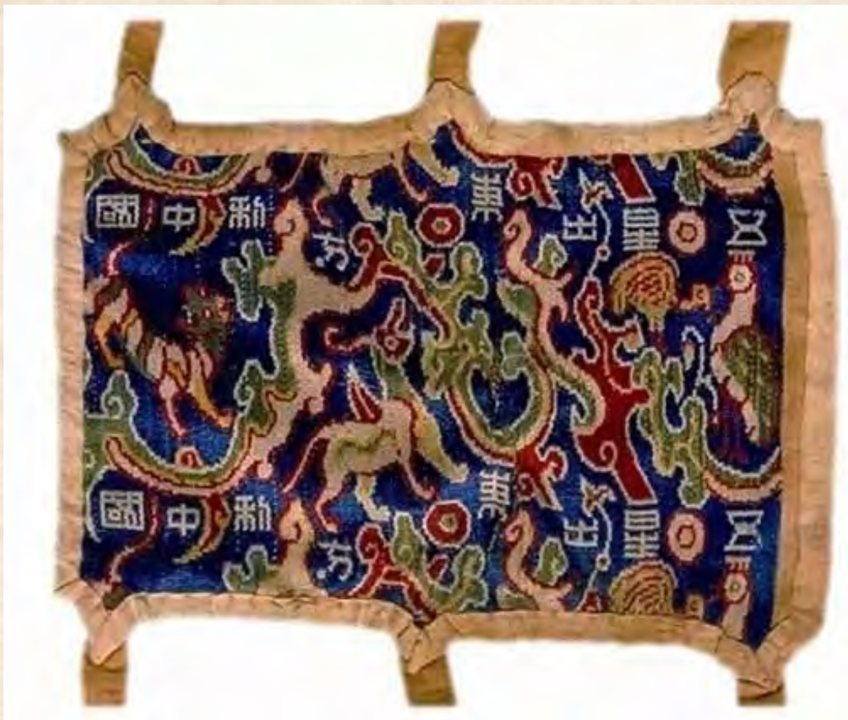
（五星出东方利中国文字织锦，汉晋时期。尼雅遗址出土）

“大茱萸”、“小茱萸”这是典籍上记载的汉锦流行花式，现在已经很难见到了，如今它在尼雅生动着。虎、龙、狮、孔雀、骆驼、鹿、马、狗、鸟，一块织锦上竟织有13种动物图案和单双舞蹈的人。