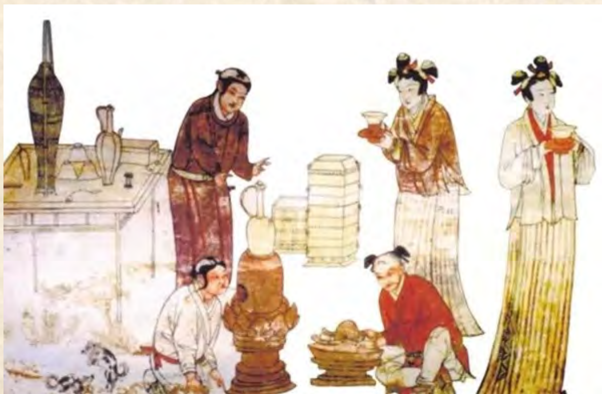
(辽墓壁画中的“厨房”)

所谓目食，袁枚指的是贪多的弊病。“今人慕食前方丈之名，多盘叠碗，是以目食，非口食也。”袁枚以为菜肴不必求多，多必不精，而且还会出疵漏。一个名厨极费尽心力，一日之中所能做出的好菜，也不过四五样味道，再多了也就是应付而已。