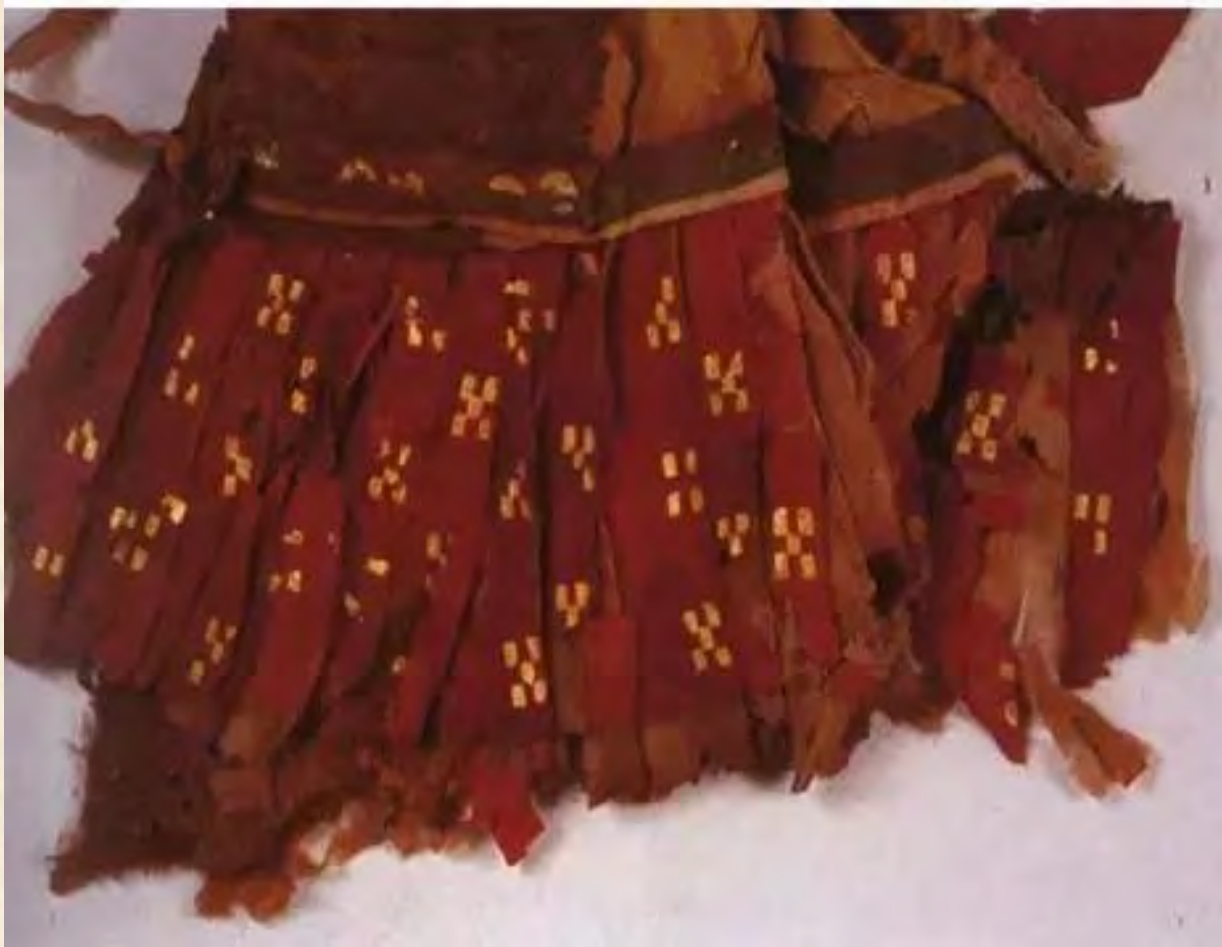
（新疆营盘墓地汉晋墓中出土的贴金衣褶）

丝绸之路是一条什么样的路？实际上它就是一条流淌着滚滚物质欲望的大路，是用人和骆驼柔软的脚步掌踩开蔓草荒芜，踏平高山大漠开出来的一条路。这条路上往来交换的是世界上不同文明所创造的不同物质，而背后驱动的，是人们享受物质财富的欲望。