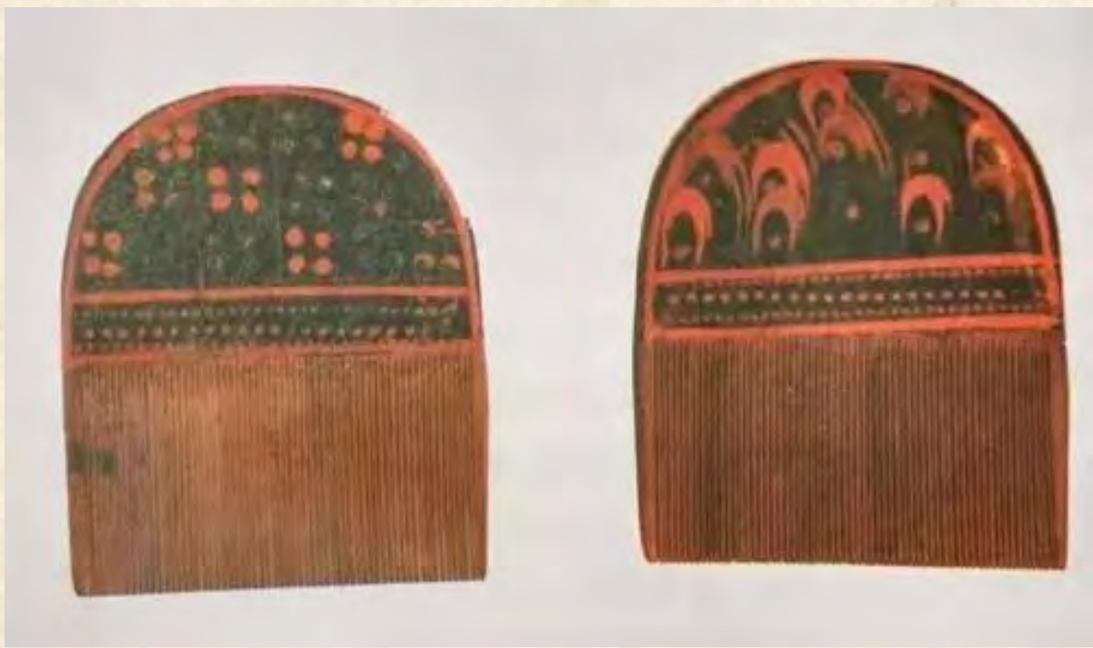
(漆篦。东汉时期。1984年新疆和田洛浦县山普拉5号墓出土)

还有绢制的小香囊4个，里面分别放着紫红、粉红、绿和白色的块状物，考古学家们搞不清是什么东西，但它可能就是今天女人的化妆颜料；针线轴上绕着蓝色和白色的丝线，一根插在上面的铁针已经生锈；两团用于化妆的丝棉团，上面还沾着红色的胭脂。还有一团东西让人惊讶，一缕黄色的长长的头发，不知道是妆奁盒主人自己的，还是她珍藏所爱之人的头发。