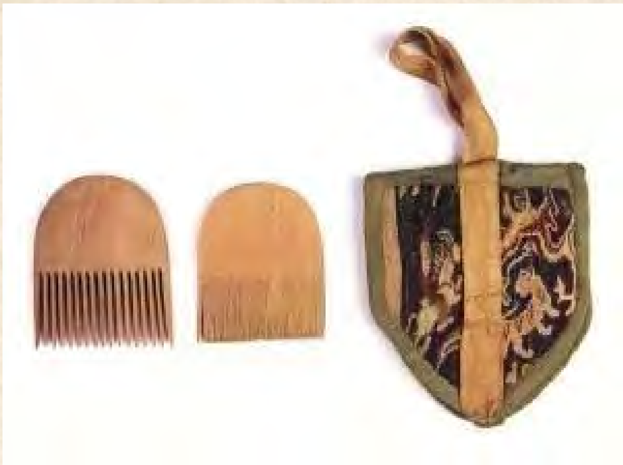
(蓝地瑞兽纹栉袋及木梳、篦。汉晋时期。新疆尼雅遗址出土)

这就是这个沙漠王国的2000年前的生活细节，上层的贵族们，以优雅的汉文贺词互致着问候，“臣承德叩头，谨以玫瑰再拜致问大王”、“苏且谨以琅玕至问春君”。玫瑰是一种美好的花儿，但当年是不是表示爱情不好说；琅玕是一种美石，辞海里的解释是，“在水为珊瑚，在山为琅玕”，玫瑰和琅玕在尼雅人之间传递，让这个小小的沙漠王国充满了优雅与情调。