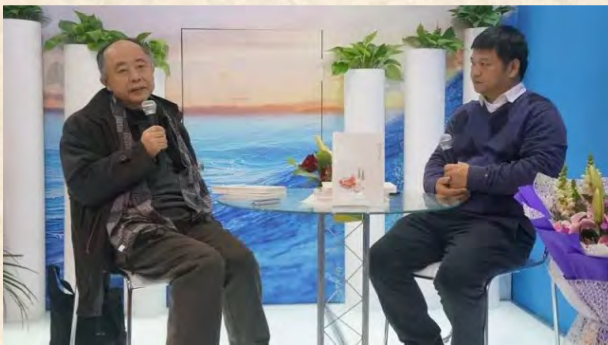
( 活动现场 )